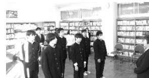
二学期終業式の様子

終業式に際し、私から自分の強みを持つとうという話をしました。なんでもできる人間はいません。どんなにすぐれた野球選手も、サッカーは苦手かもしれません。自分のがんばれそうなこと、好きなこと、そこに集中することの大切さを伝えました。それはやがて、自分らしさ、あなたらしさを形成してくれる。そんな集中できる何かに取り組む、見つける、冬休みにしてほしいと思います。